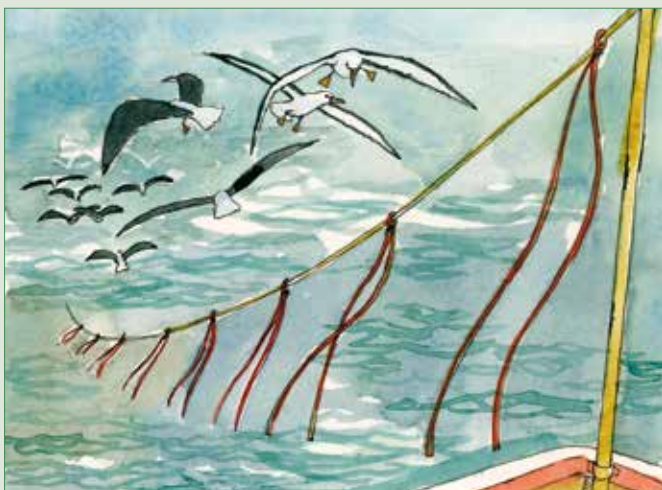
Figure 1. Les lignes de banderoles dissuadent les oiseaux marins d'attraper les appâts fixés aux hameçons.

La force et la direction du vent par rapport au cap du navire peuvent faire dévier la ligne de banderoles de sa position