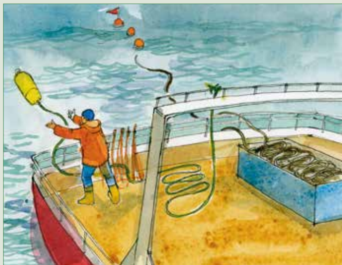
Figure 2. Les lignes de banderoles doivent être déployées avant que le premier hameçon ne quitte le navire.

Les lignes de banderoles doivent être déployées avant que le premier hameçon n'entre dans l'eau et doivent être récupérées une fois le dernier hameçon posé.