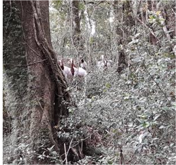
22 diciembre 2021. 5 cabras registradas en sendero laguna Hermosa. Reserva Nacional Isla Mocha.