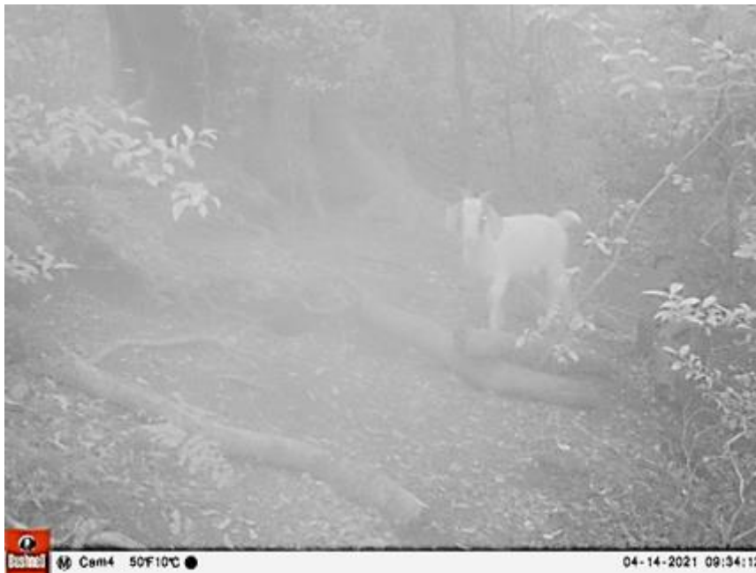
14 abril 2021. 1 cabra registrada en cuadrante 1 (38°21'15.6", 73°55'13.8") colonia nidificación fardela blanca. Reserva Nacional Isla Mocha.

Los registros anteriores demuestran que las cabras recorren amplios sectores de la Reserva Nacional Isla Mocha hasta sus zonas altas, llegando incluso hasta las colonias reproductivas de fardela blanca ( Ardenna creatopus ).