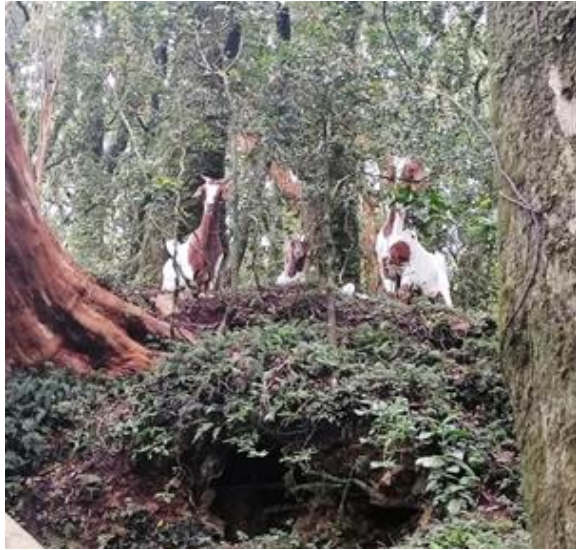
13 diciembre 2021. 3 cabras registradas en cuadrante 1 colonia nidificación fardela blanca. Reserva Nacional Isla Mocha.