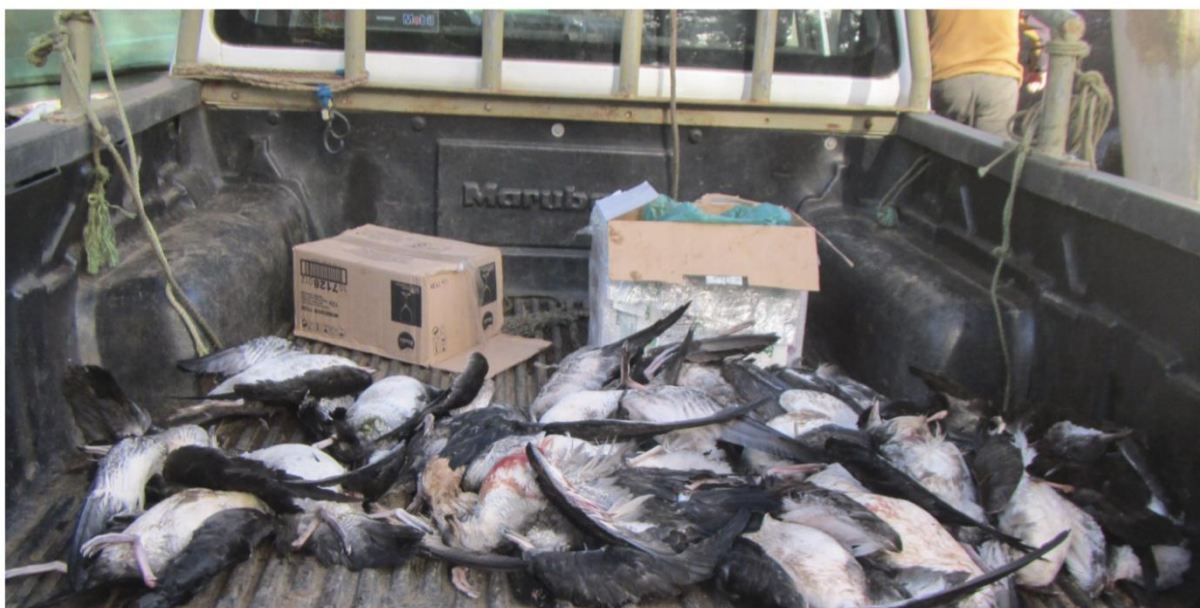
Figura 3. Ejemplares de Ardenna creatopus muertos y recuperados por CONAF durante mayo 2020 en el poblado de San Juan Bautista en Robinson Crusoe.

Este aumento considerable en fardelas blancas caídas se debe a las nuevas luminarias públicas instaladas en el borde costero sur de la zona poblada de Robinson Crusoe. Actualmente, Oikonos realiza gestiones con el Ministerio de Obras Públicas y el Municipio para, en el corto plazo, reducir la intensidad de estas luminarias, y al largo plazo cambiar de las luminarias del poblado de manera que se acojan a la nueva legislación que regula la contaminación lumínica en Chile.