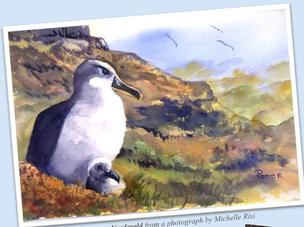
Artwork by Virginia Potter Vredeveld from a photograph by Michelle Risi