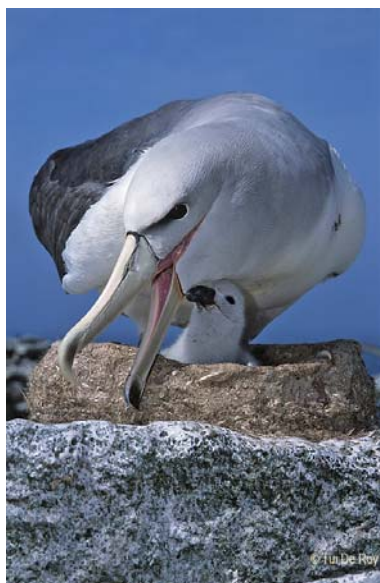
Foto © Tui De Roy, no debe ser usada sin el permiso del fotógrafo