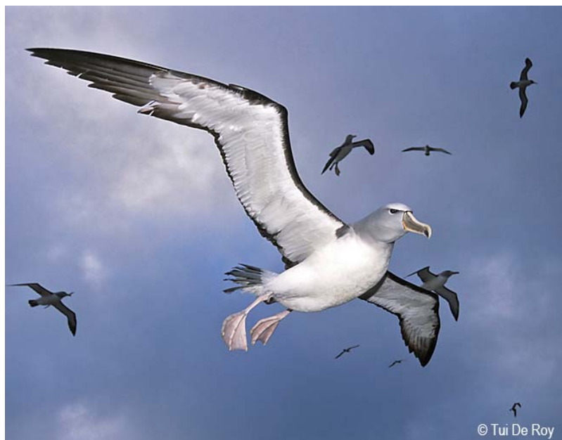
Foto © Tui De Roy, no debe ser usada sin el permiso del fotógrafo

También se necesita con urgencia mayor conocimiento sobre como afectan las operaciones de pesca en la captura incidental de aves en Chile y Perú, donde un gran número de adultos y juveniles se concentran.